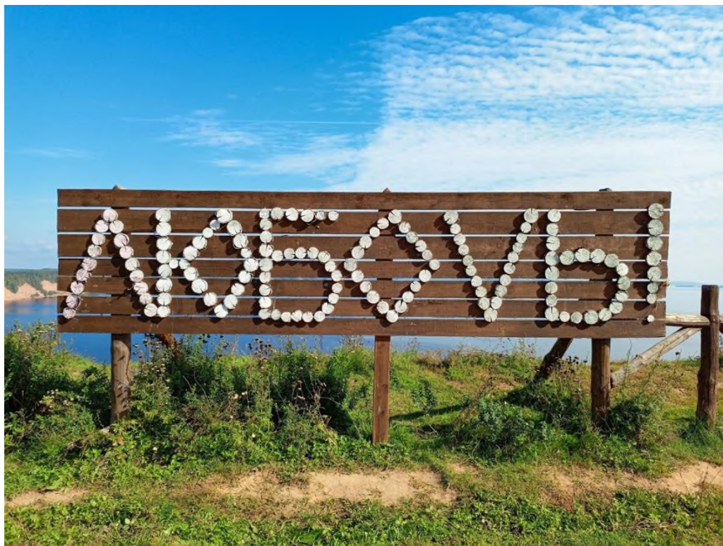
Фото 1. Смотровая площадка «Мыс любви». Арт объект «ЛюбоVь!» Автор: Машкина В.