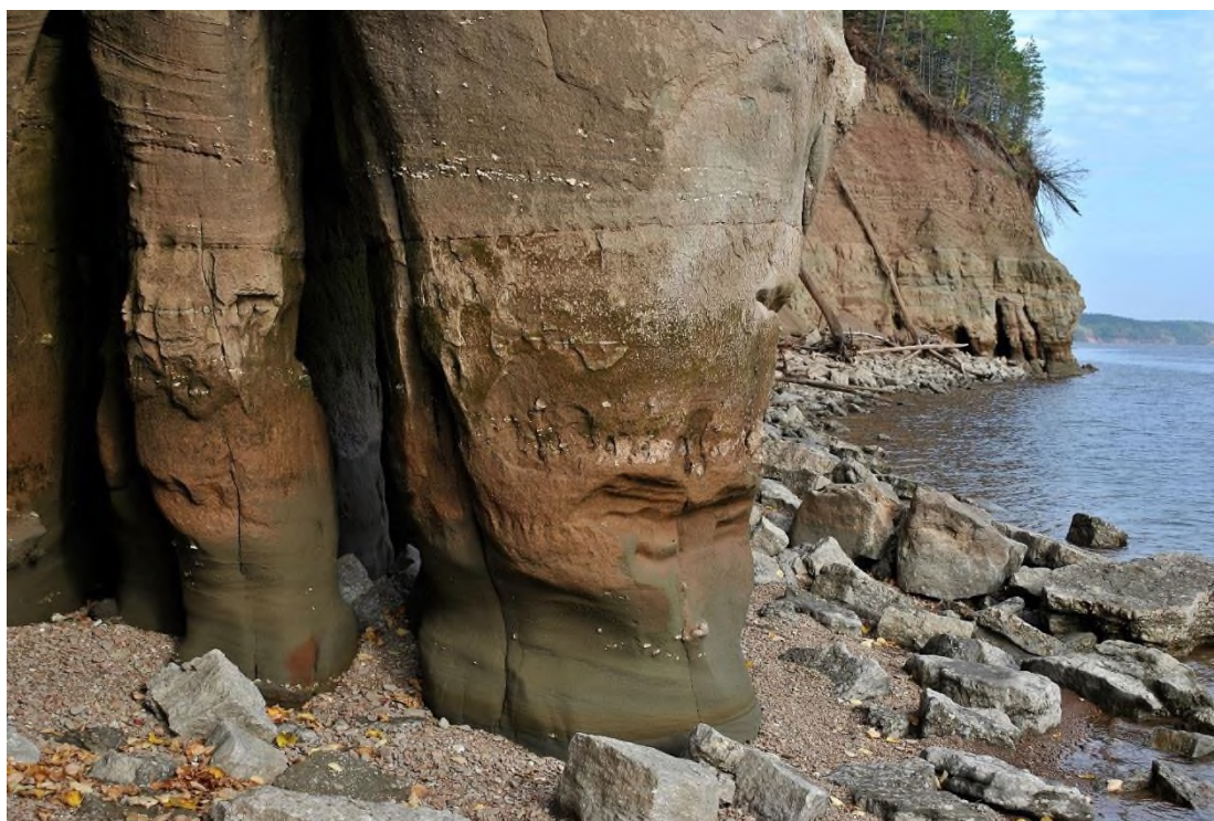
Фото 2. Берег Воткинского водохранилища у стоянки «Дикого мамонта».