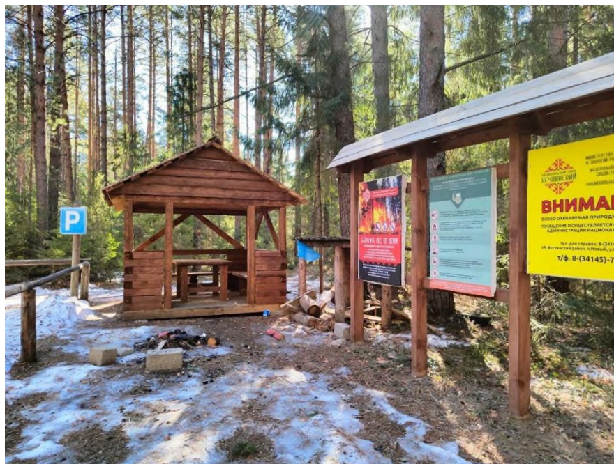
Фото 3. Место отдыха «КП 15» у деревни Костоваты.