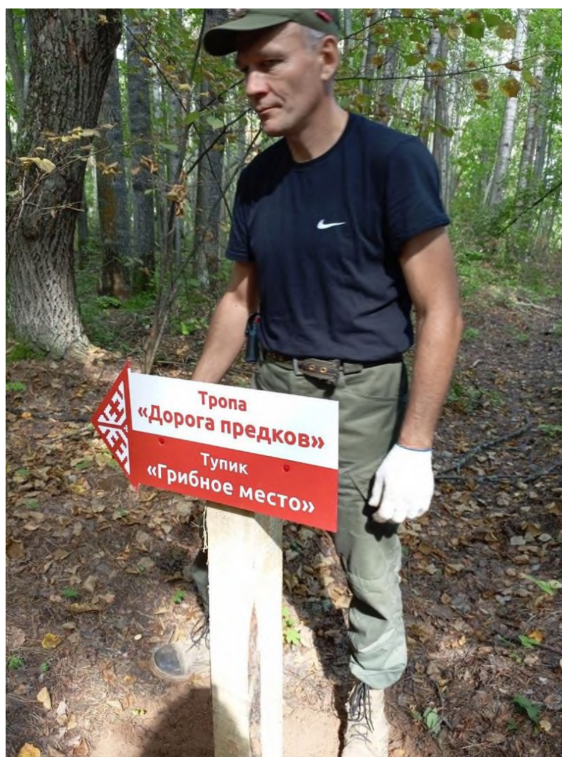
Фото 4. Навигационный знак на тропе.