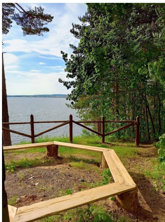
Фото 6. Смотровая площадка «Рассвет» с видом на Воткинскую ГЭС.