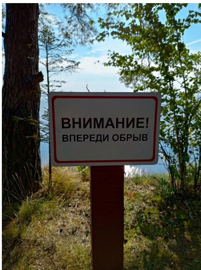
Фото 5. Предупреждающие таблички на тропе.