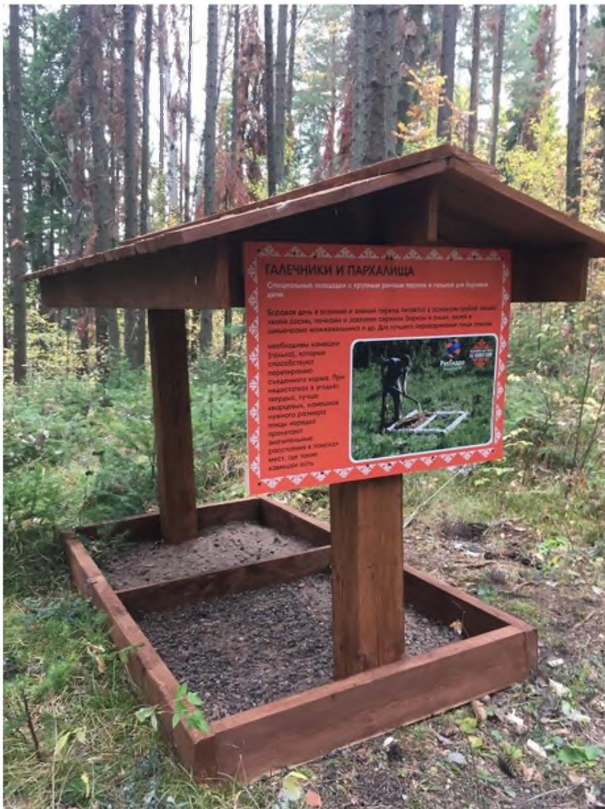
Фото 4. Биотехническое сооружение. Автор: Дубовцева Е.В.