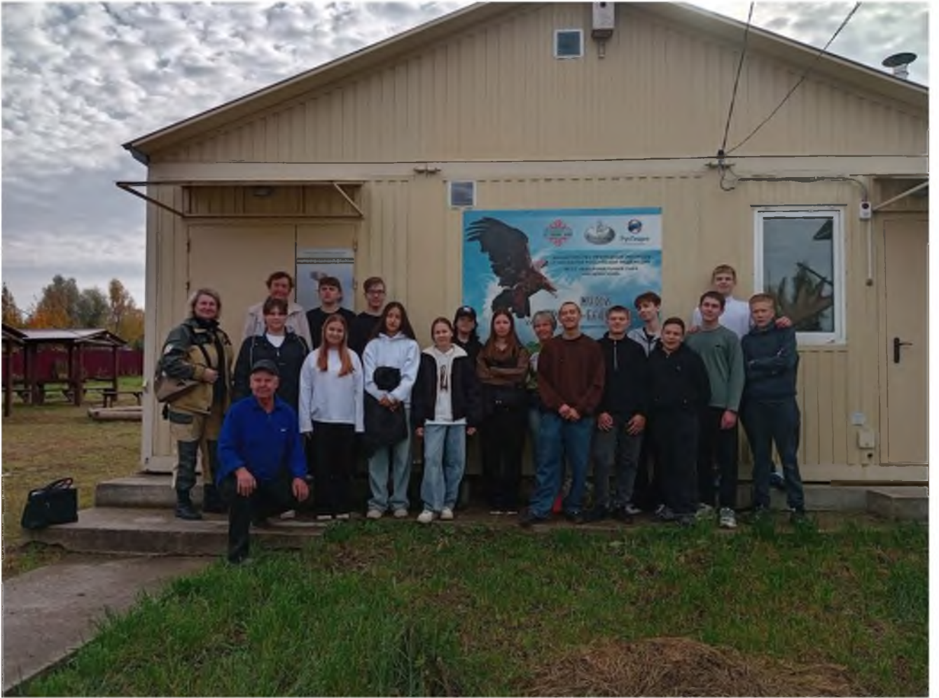
Фото 5. Визит-центр «Орланы кручи».