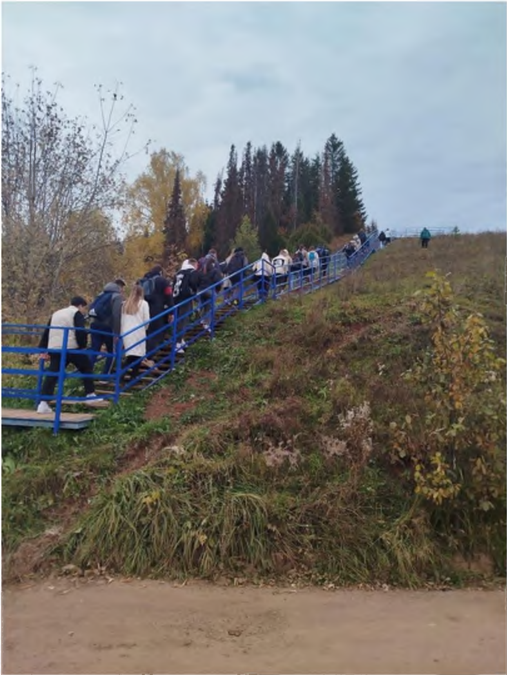
Фото 3. Лестница на смотровую площадку.