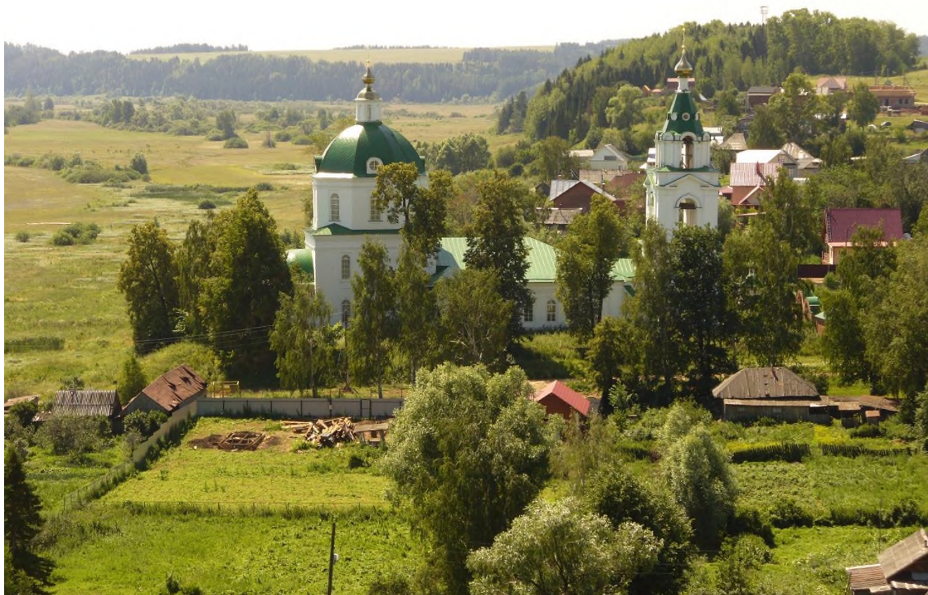
Фото 1. Вид со смотровой площадки на с. Нечкино.