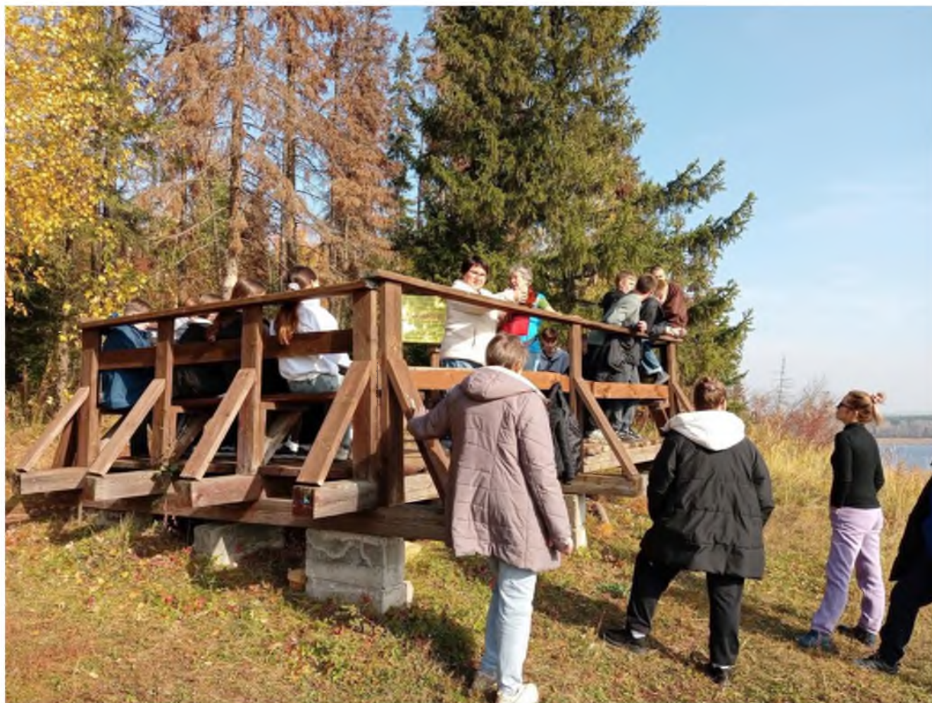
Фото 2. Смотровая площадка на маршруте, оборудованная 3 скамьями для отдыха.