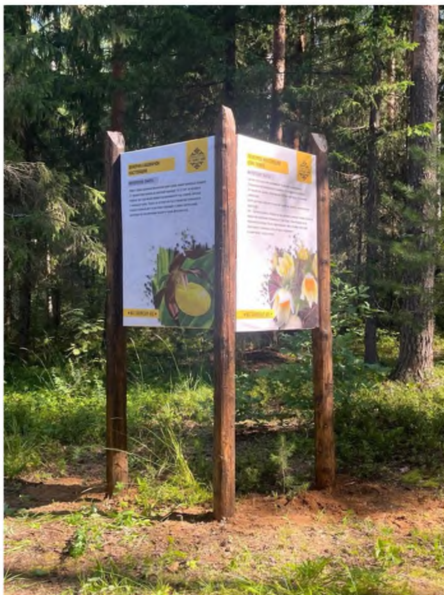
Фото 2. Информационные стенды по тропе.