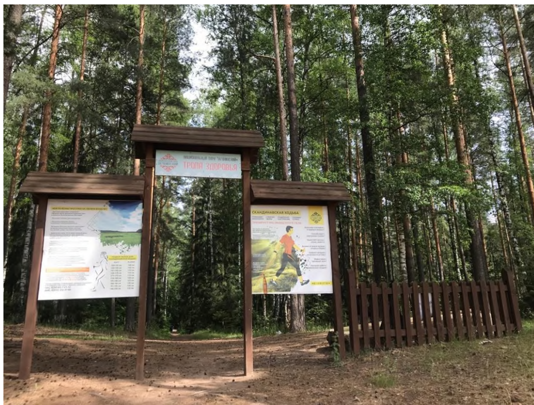
Фото 1. Входная группа.