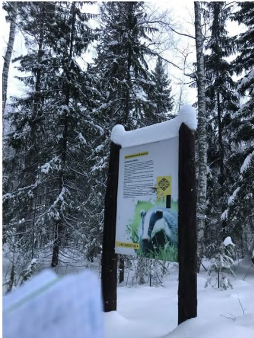
Фото 3. Стенд с информацией о животном.