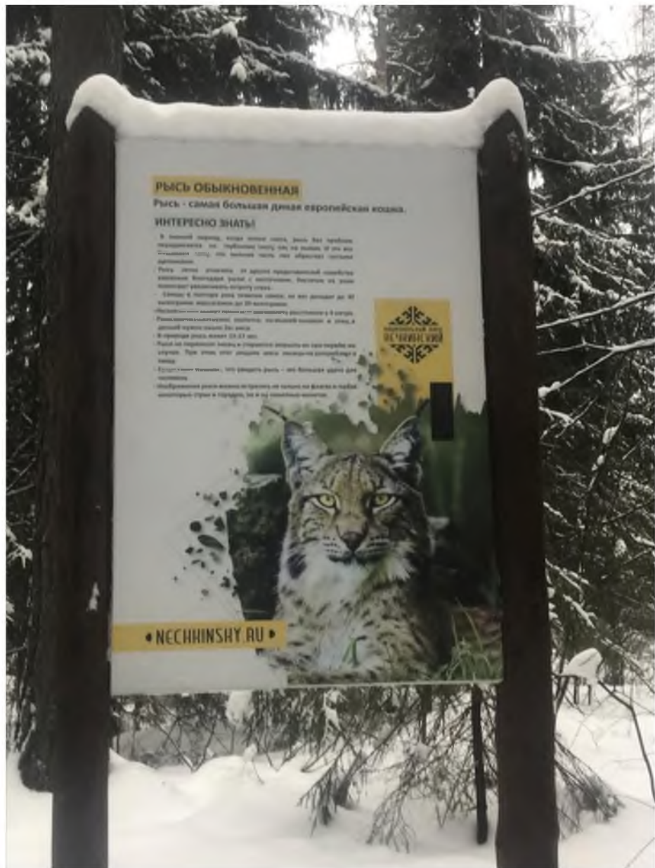
Фото 4. Стенд с информацией о животном.