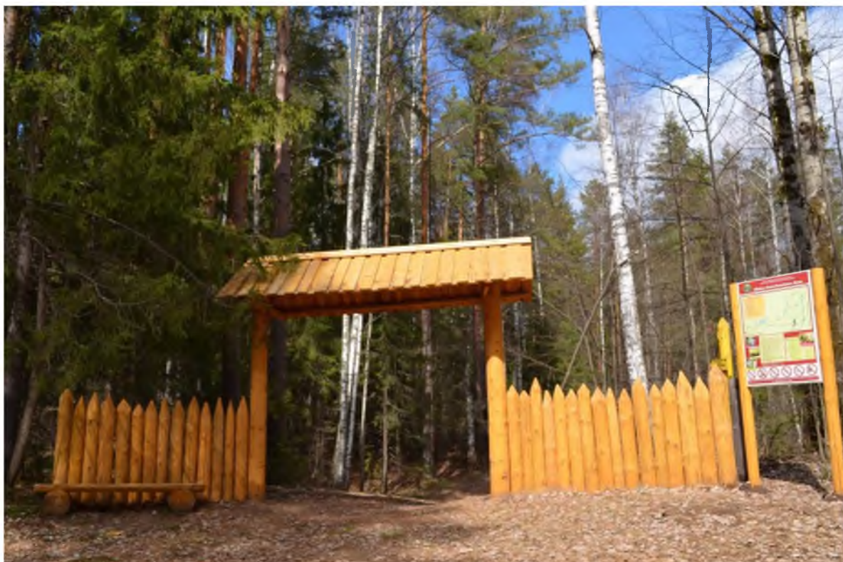
Фото 7. Входная группа на тропу «Тайны «Костоватовского бора» с информационным стендом «Карта маршрута». Автор: Миронова Н.Л.