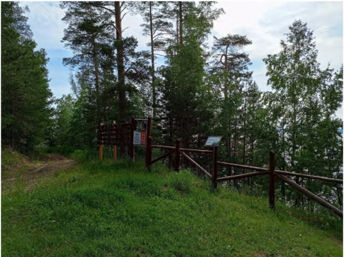
Фото 6. Место отдыха со смотровой площадкой «Рассвет».