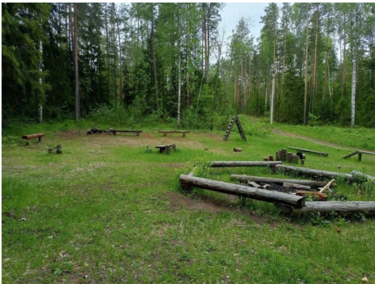
Фото 5. Место отдыха «Круглая беседка».